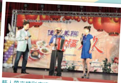
藝人帶來精彩表演